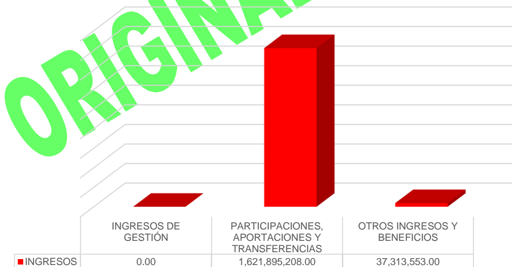
Gráfico 1. Ingresos

Fuente: Estado de Actividades presentado por el Ente Fiscalizable.